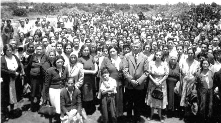
Zuhörer in Mexiko zur Zeit von Walter Maier

Schon frühzeitig ließ Christus Seine Zuhörer wissen, daß Seine Lehrtätigkeit durch den menschlichen Verstand zeitlich begrenzt sein werde, und Er nannte das Jahr 1950. (Von 1866 an, 7 \times 12 = 84 Jahre.) Außerdem erwähnte der Göttliche Meister einige Jahre vor 1950 des öfteren, daß Er in den letzten drei Jahren Seine geistigen Belehrungen steigern werde, damit Seine Kinder einen größeren geistigen Fortschritt machen können.»